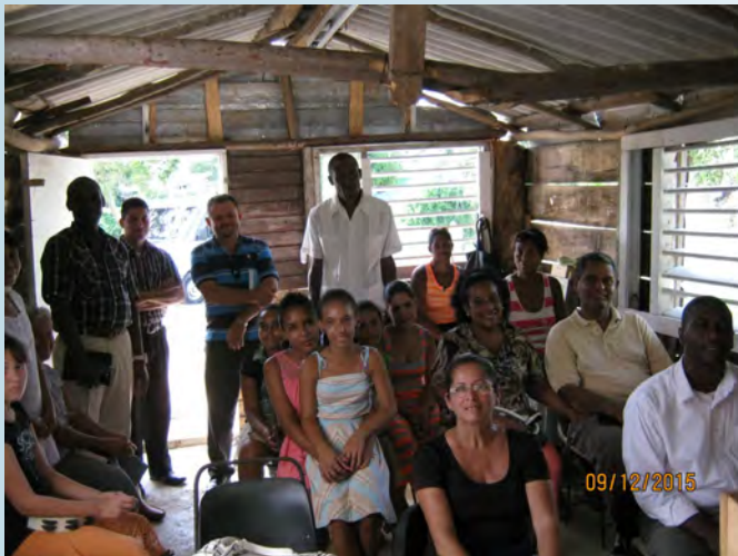
Église de la Mission