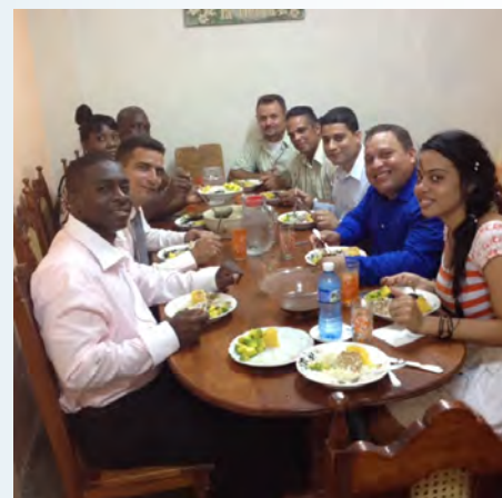
Déjeuner avec la direction