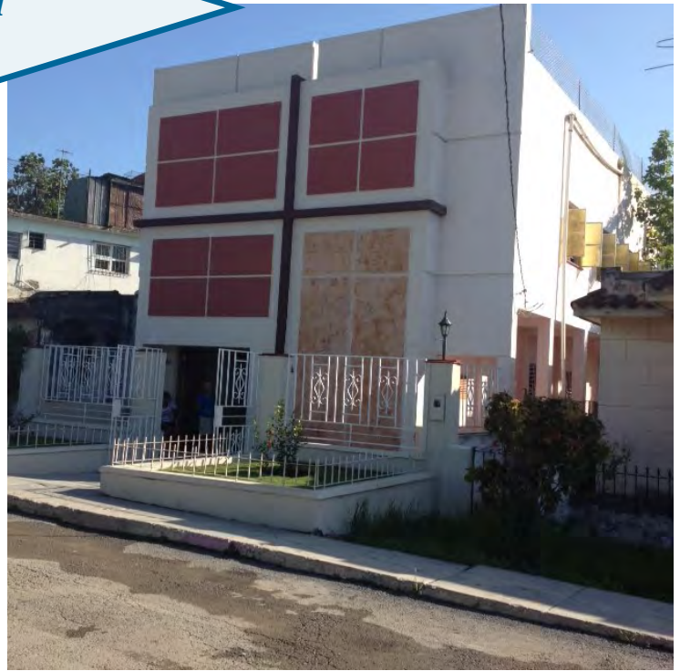
Temple Principal "Rehoboth" de l'église de la Mère à La Havane