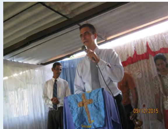
Pasteur de l'église de 3 heures au sud-ouest de La Havane